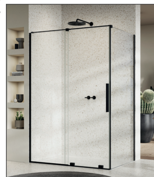
↑ PLUME Porte coulissante 2 volets ACD35S2 + Paroi fixe à 90° ACD35F1 (Noir mat)