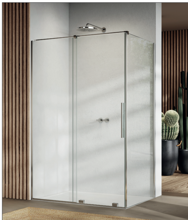
↑ PLUME Porte coulissante 2 volets ACD35S2 + Paroi fixe à 90° ACD35F1 (Poli-brillant)